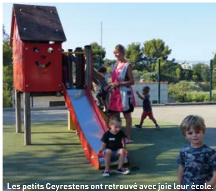
Les petits Ceyrestens ont retrouvé avec joie leur école.