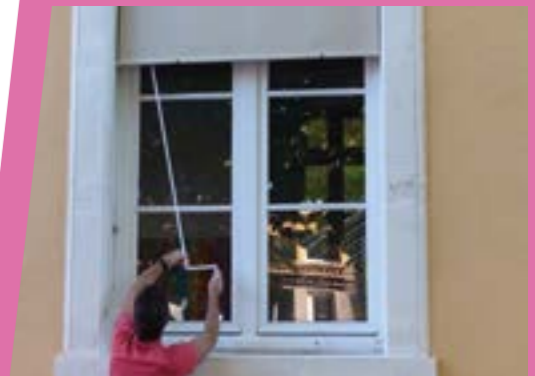
Des stores extérieurs ont été installés sur les fenêtres du bâtiment le plus ancien, afin de protéger les élèves de la chaleur du soleil.