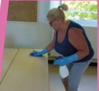
Dans les classes, l'été rime avec grand ménage. Des heures à astiquer, laver, dépoussiérer... Aucun recoin n'a échappé à nos agents !