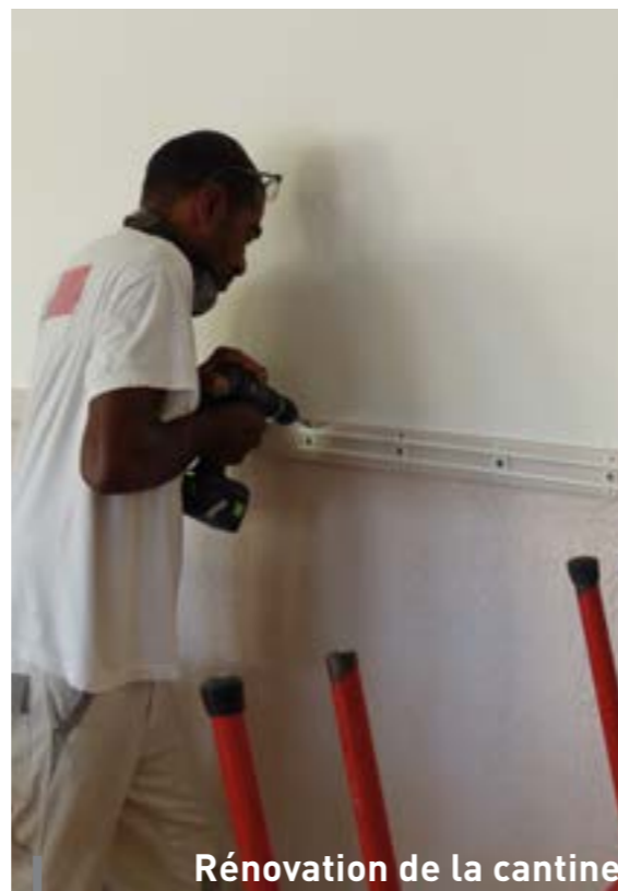
Rénovation de la cantine

Les containers placés devant la cantine de l'école élémentaire sont désormais à l'abri des regards. Un élément de mobilier urbain qui contribue, là encore, à améliorer notre qualité de vie au quotidien.