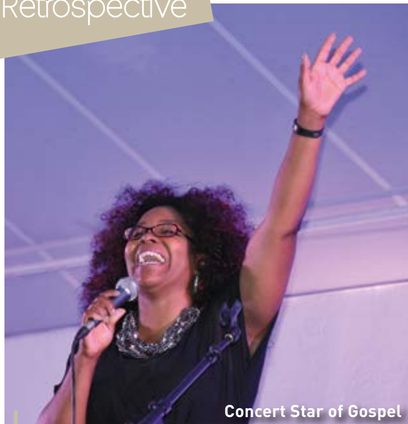
Concert Star of Gospel

Le Samedi 9 juillet a enflammé la salle Polyvalente. Ce concert de grande qualité de la chanteuse américaine a littéralement envoûté l'assistance ! Difficile de ne pas bouger sur sa chaise... !