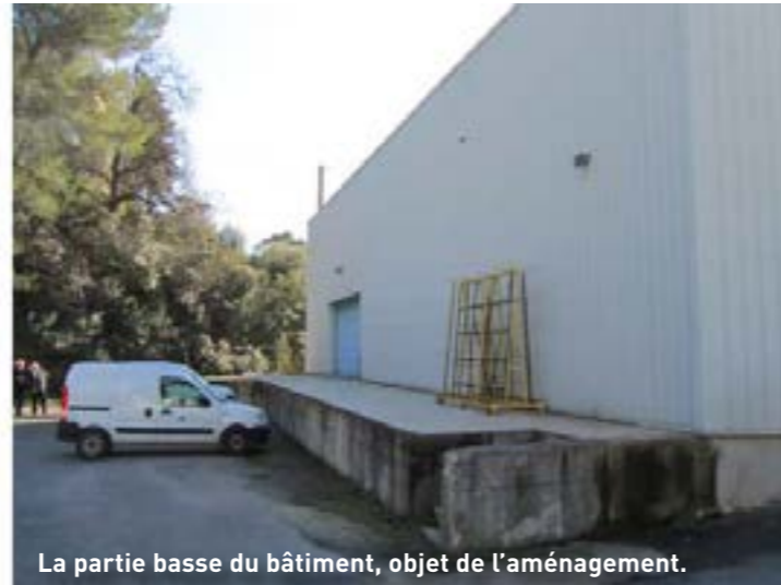
La partie basse du bâtiment, objet de l'aménagement.