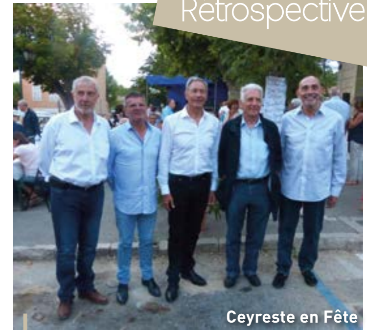
Ceyreste en Fête

La météo a certes quelque peu gâché la fête, mais le 13 Juillet, la tradition a été respectée, avec une retraite aux flambeaux chaleureuse et conviviale, clôturée par l'embrasement de la place Albert Blanc, déclenché par le Maire.