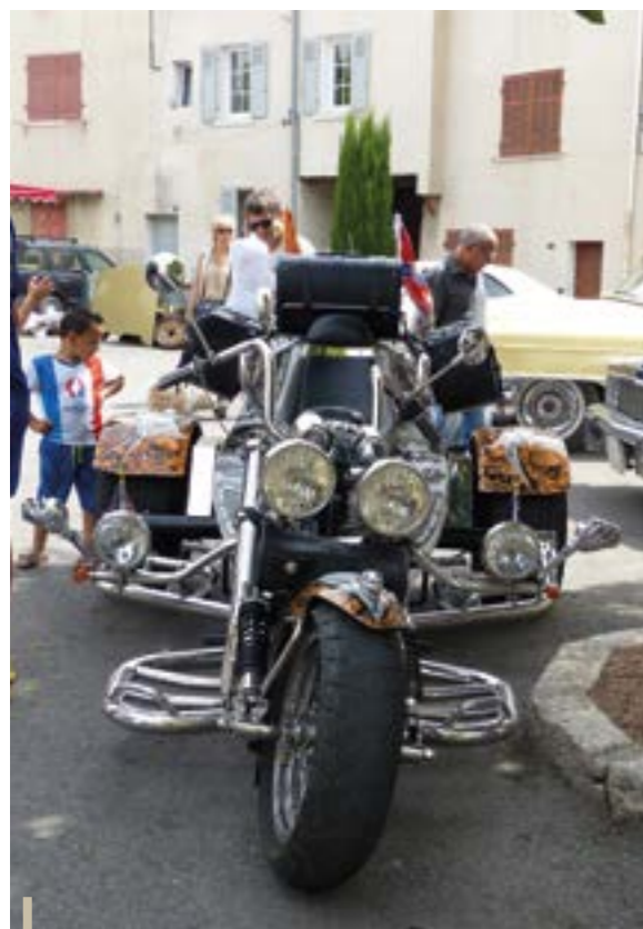
Des spécimens parfois déroutants jalonnaient les rues du village entre étonnement et admiration.