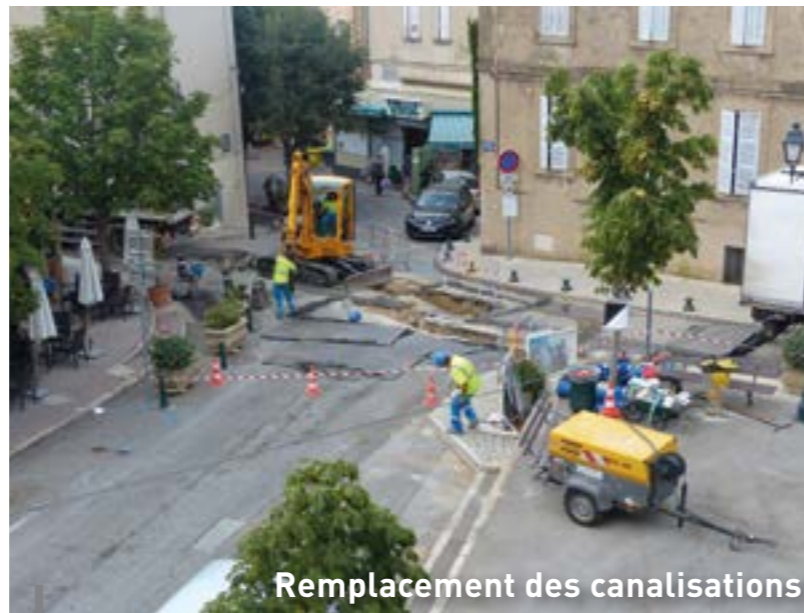
Remplacement des canalisations

Après de multiples actes de vandalisme qui ont nécessité une rénovation totale, les toilettes publiques fonctionnent et sont désormais ouvertes en journée (non accessibles la nuit, par mesure de sécurité)