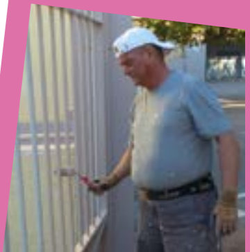
De nombreux travaux de peintures ont été réalisés par les services techniques municipaux dans l'école élémentaire : salle de classe, façades, portails...