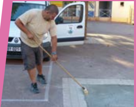
Deux arbres malades ont dû être abattus dans la cour... En attendant la nouvelle plantation (impossible en été), une dalle en béton léger a été confectionnée pour la sécurité de nos petits.