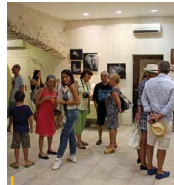
En Août, deux artistes ceyrestens ont investi la salle du Moulin pour une exposition vente de superbes objets artisanaux.