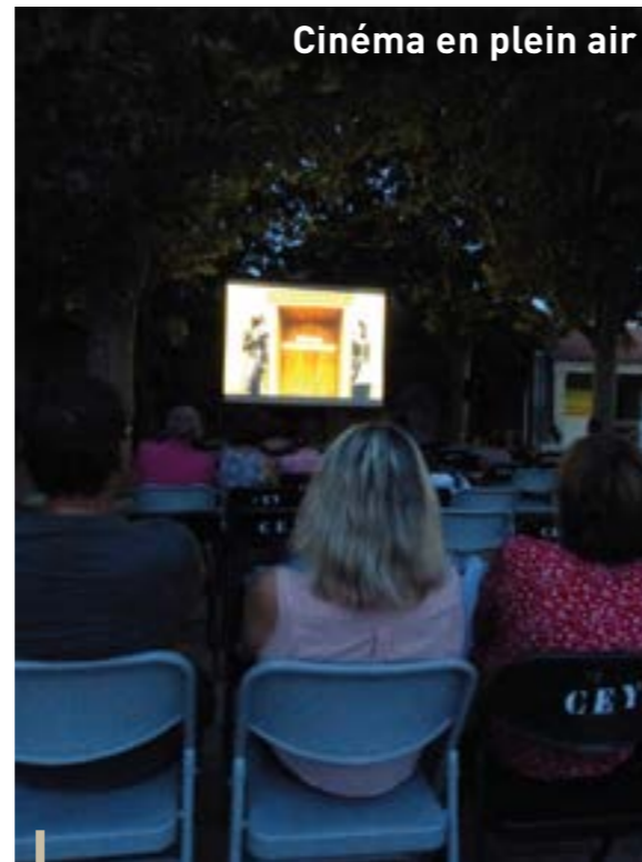
Cinéma en plein air

Le Samedi 9 juillet a enflammé la salle Polyvalente. Ce concert de grande qualité de la chanteuse américaine a littéralement envoûté l'assistance ! Difficile de ne pas bouger sur sa chaise... !