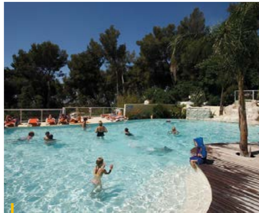
Comme chaque été, le camping a accueilli de très nombreux touristes. La qualité de l'accueil et des installations garantit le séjour de vacanciers comblés !