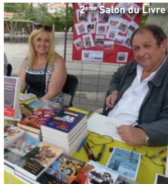
2 ème Salon du Livre

Le 21 Juin, la Fête de la Musique s'est jouée sur des accents Marseillais et humoristiques ; le chanteur ceyresten a enjoué l'assistance, avec son « Blues du Marseillais ».