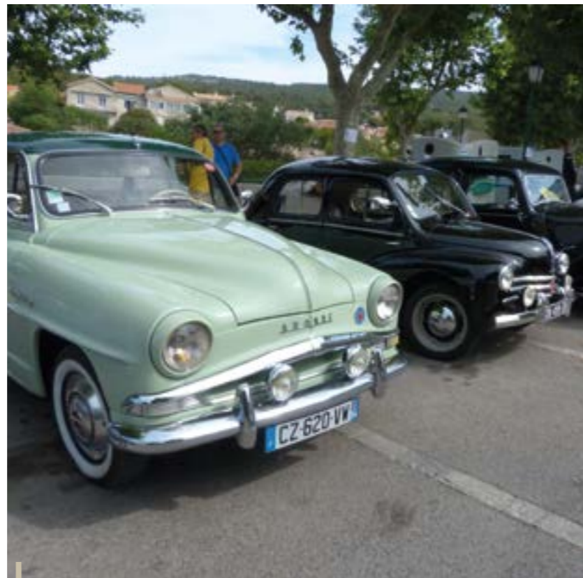
La place des Héros s'est plongée quelques décennies en arrière, en admirant les formes élégantes et arrondies de voitures parfaitement entretenues ou restaurées.