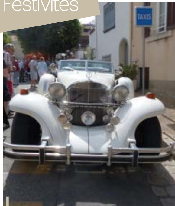
L'Excabur de Rémi Riel a décroché le 1er prix ! Un véhicule qui a impressionné les nombreux visiteurs de cette exposition à ciel ouvert.