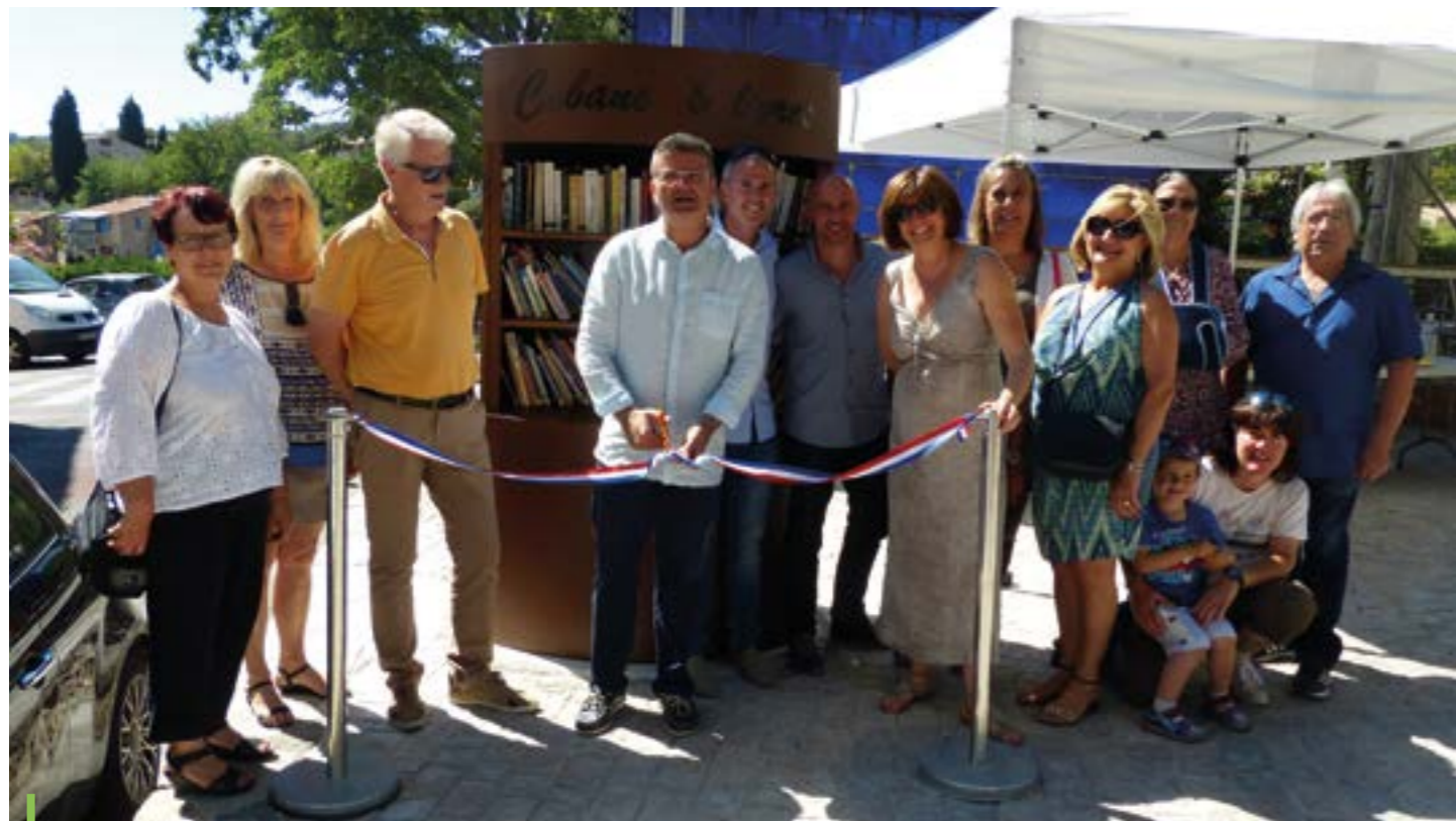
Le Maire, entouré de plusieurs élus lors de l'inauguration de la Cabane à Livres le Mardi 28 juin sur la place de la Mairie.

A Ceyreste, nous parions sur la culture ! Il y a peu, un nouvel élément est venu s'implanter sur la place de la Mairie : une cabane à livres. Elle est visible autant que possible, elle se veut fonctionnelle, conviviale et esthétique !