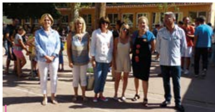
En Juin, l'APE a organisé la traditionnelle kermesse, permettant aux enfants de s'amuser, mais aussi apportant à cette occasion des moyens financiers pour l'association.