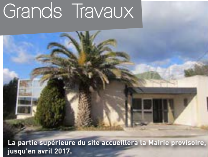
La partie supérieure du site accueillera la Mairie provisoire, jusqu'en avril 2017.