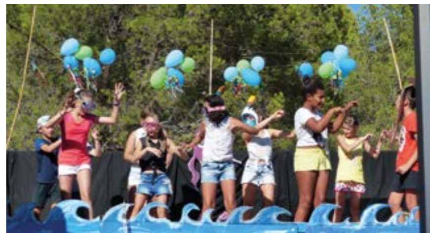
Un été au centre de loisirs

La cantine de l'école élémentaire a été repeinte durant les vacances d'été, permettant ainsi à nos enfants de déjeuner dans un cadre toujours plus agréable.