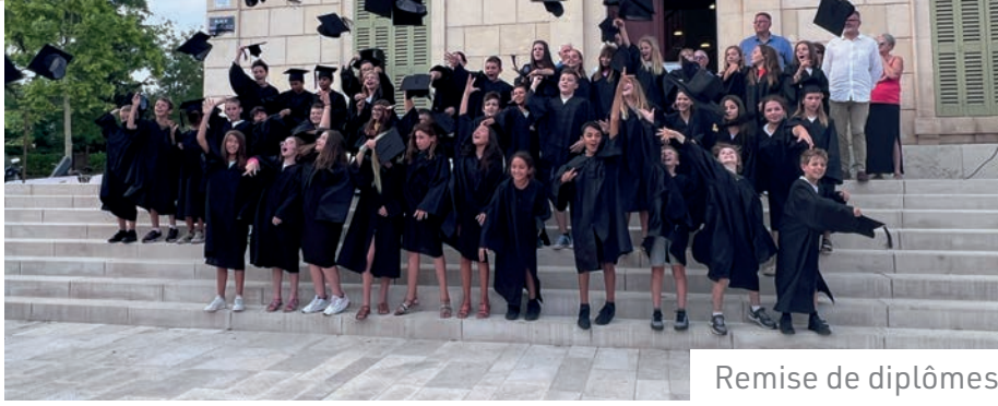
Remise de diplômes