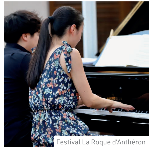
Festival La Roque d'Anthéron