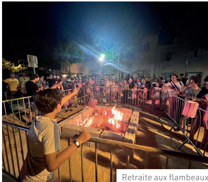
Retraite aux flambeaux