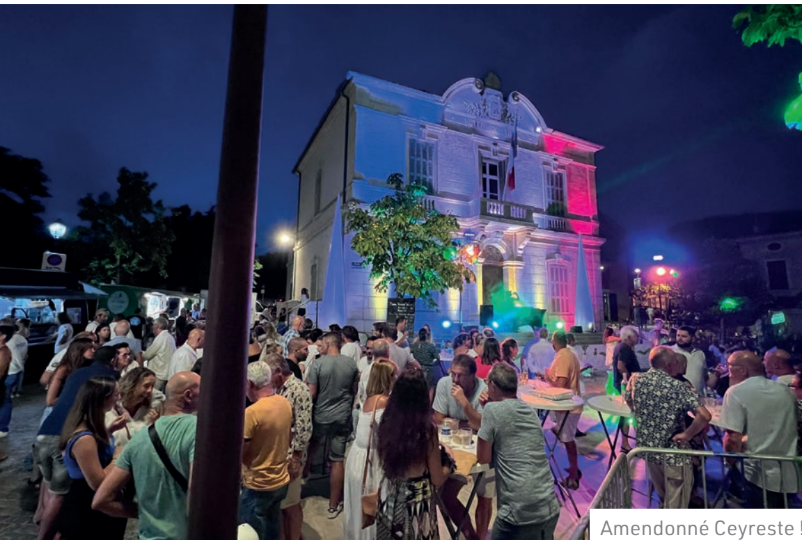
Amendonné Ceyreste !