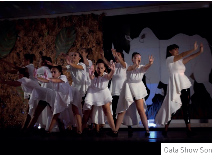
Gala Show Son