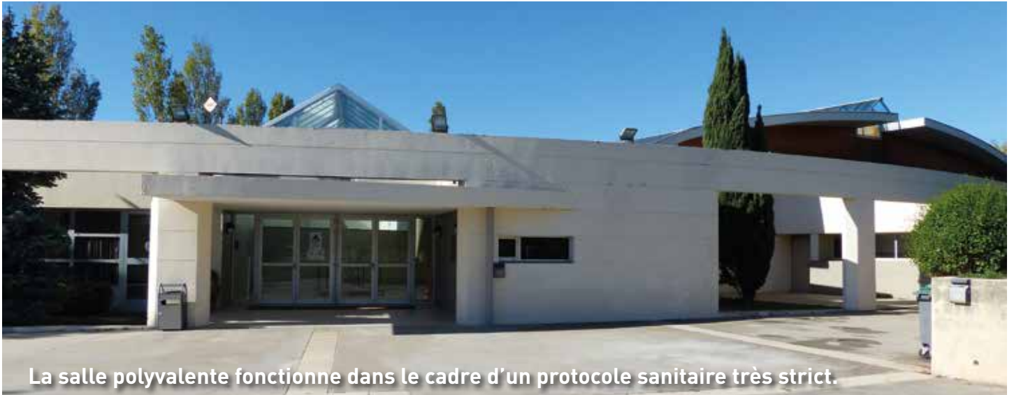
La salle polyvalente fonctionne dans le cadre d'un protocole sanitaire très strict.

Outre l'action de fond menée durant l'été pour procéder à une désinfection totale des locaux municipaux, en particulier scolaires, un protocole quotidien a été mis en place visant, en plus du ménage effectué chaque matin ou soir, à procéder à une désinfection des endroits sensibles (poignées de porte, chaises, mains courantes) en moyenne 2 fois par jour, selon la fréquentation du bâtiment concerné et le public visé.