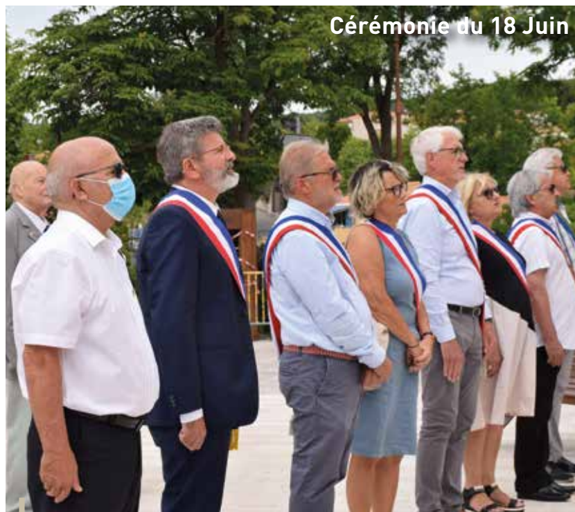
Cérémonie du 18 Juin

A l'occasion de la Fête Nationale en juillet, le boulevard Alphonse David avait été totalement paré des couleurs du drapeau Français. Depuis Septembre, un nouveau visuel a pris place, aux couleurs du logo de la Ville.