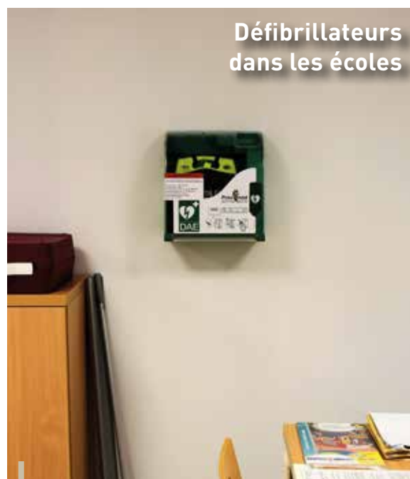
Défibrillateurs dans les écoles

Crise sanitaire oblige, c'est sans public et sans enfants des écoles que s'est déroulée la Cérémonie du célèbre Appel du Général de Gaulle, le 18 Juin 2020. C'est en présence du Maire de Ceyreste et de nombreux élus, ainsi que des représentants du Club du 18 Juin, des Anciens Combattants et du Souvenir Français que s'est tenue la cérémonie en comité restreint.