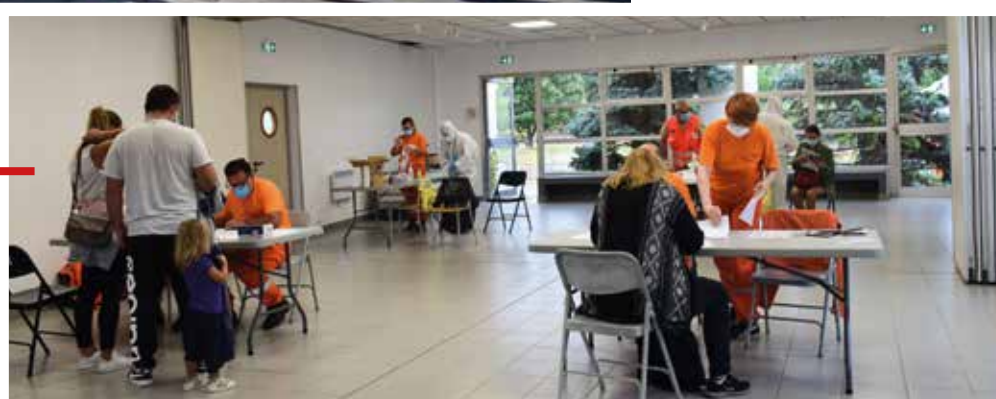
Dépistage organisé par la Commune en partenariat avec le Sdis 13 et le Département des Bouches-du-Rhône, avec la précieuse collaboration des bénévoles de la Réserve Communale.