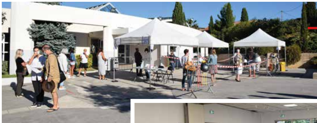
Dépistage organisé par la Commune en partenariat avec le Laboratoire BioLittoral et l'association CPTS des Vignes et Calanques.