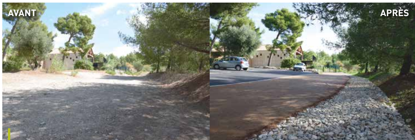
Une zone naturelle d'infiltration des eaux pluviales a été réalisée (drain et ballast) afin de diminuer les écoulements des eaux sur l'avenue Eugène Julien.

Ces travaux ont été subventionnés par le Département des Bouches-du-Rhône à hauteur de 70% dans le cadre du dispositif « travaux de proximité ».