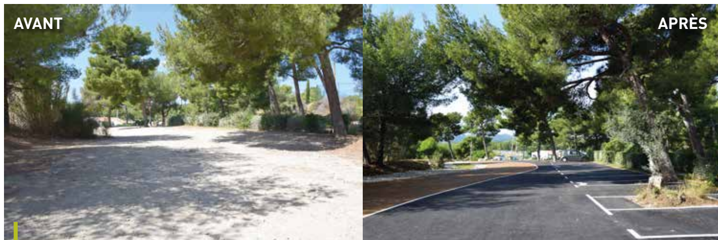
Des espaces verts ont pu être préservés ou aménagés avec des arbres déjà existants, afin de conserver l'esprit naturel du lieu, en proximité de notre massif forestier.