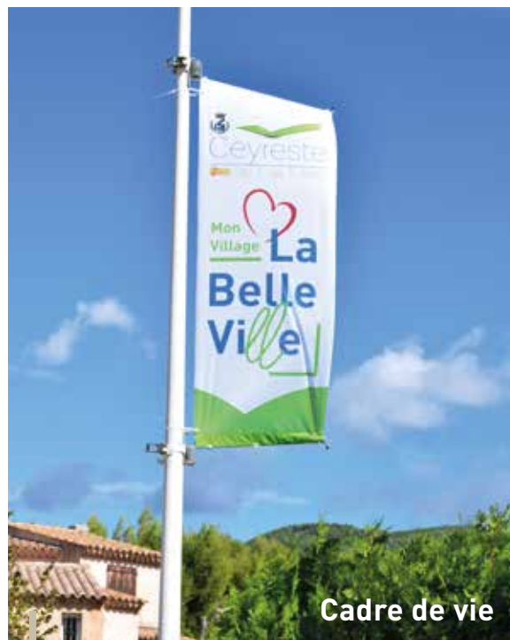
Cadre de vie

Le 30 septembre, nous avons eu la joie de bénéficier du spectacle L'HOMME QUI PLANTAIT DES ARBRES, d'après l'œuvre de Jean Giono, dans le cadre de la saison Tous aux arbres ! organisé par la Bibliothèque Départementale.