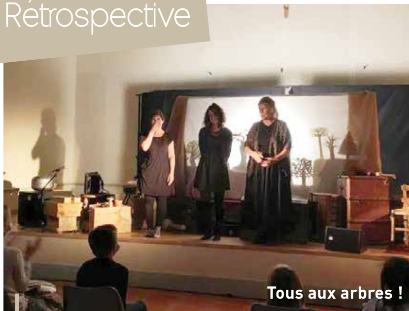
Tous aux arbres !

Le 30 septembre, nous avons eu la joie de bénéficier du spectacle L'HOMME QUI PLANTAIT DES ARBRES, d'après l'œuvre de Jean Giono, dans le cadre de la saison Tous aux arbres ! organisé par la Bibliothèque Départementale.