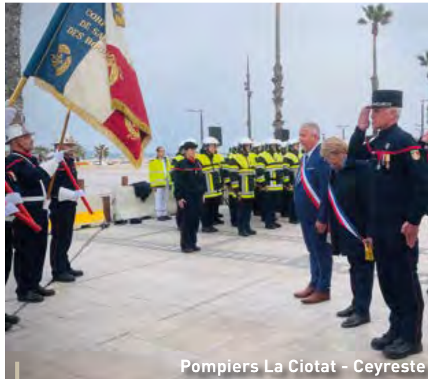
Pompiers La Ciotat - Ceyreste

Résultats des deux tours de l'élection présidentielle de 2022 : Premier tour - Taux de participation : 78,57 % Second tour - Taux de participation : 77,58 % → Emmanuel Macron : 1384 voix → Marine Le Pen : 1481 voix