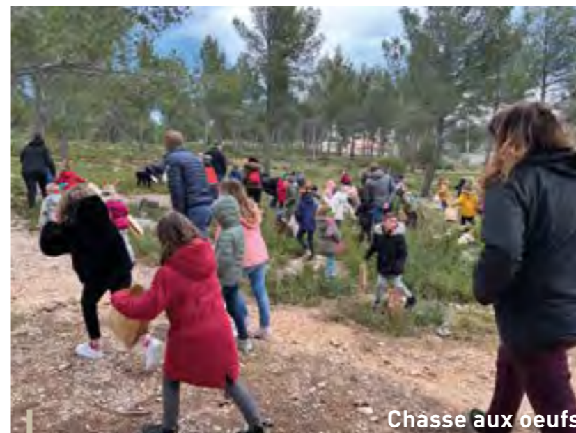
Chasse aux oeufs

Dans le cadre de la gestion des risques majeurs, la Commune de Ceyreste s'est dotée du système d'alerte RING de Cedralis afin de vous avertir rapidement et directement (Vocal ou SMS) si vous êtes concernés par un événement de sécurité civile (phénomène météorologique intense, accident industriel, pollution du réseau d'eau potable, etc.). Pour bénéficier gratuitement de ce service, il suffit de vous inscrire sur https://inscription.cedralis.com/Ceyreste