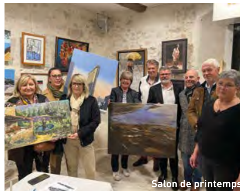
Salon de printemps

Un grand succès pour la chasse aux œufs de Pâques organisée par la Ville de Ceyreste le samedi 2 avril, en partenariat avec le Comité des Fêtes. Une chasse aux œufs, de nombreuses animations et pour couronner le tout : distribution de chocolats, de pop-corn et de barbes à papa. Merci à nos élus et au Comité des Fêtes pour cet après-midi qui, malgré le vent, a réchauffé le cœur de nos petits !