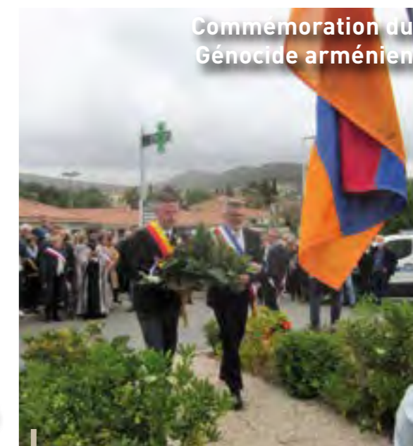
Commemoration du Génocide arménien

Nos petits ceyrestens avaient rendez-vous à la Salle Polyvalente le jeudi 31 mars. Le Comité Des Fêtes de Ceyreste avait organisé un spectacle de magie « Magic Mousse ». Sans surprise, tout le monde était comblé, les petits comme les plus grands. Merci au Comité des Fêtes d'avoir fait rêver nos enfants !