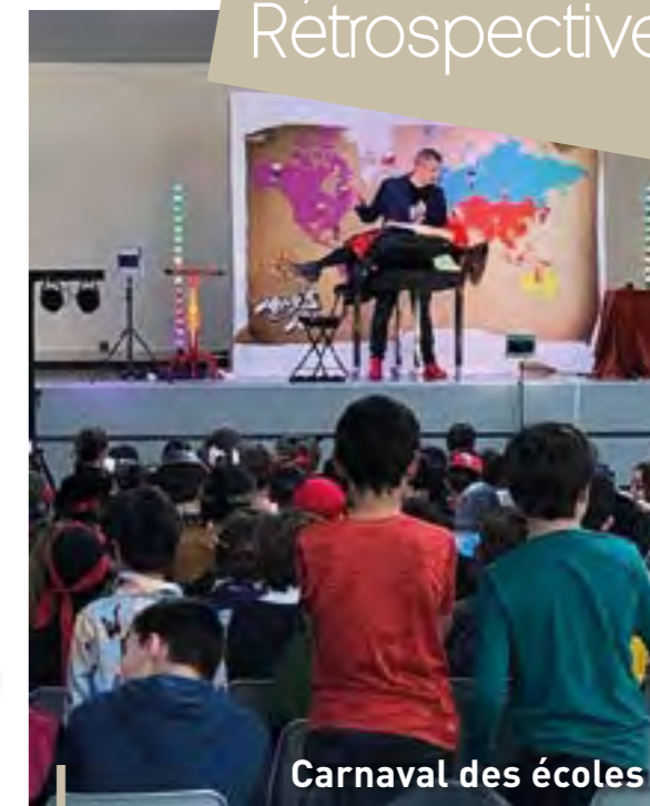
Carnaval des écoles