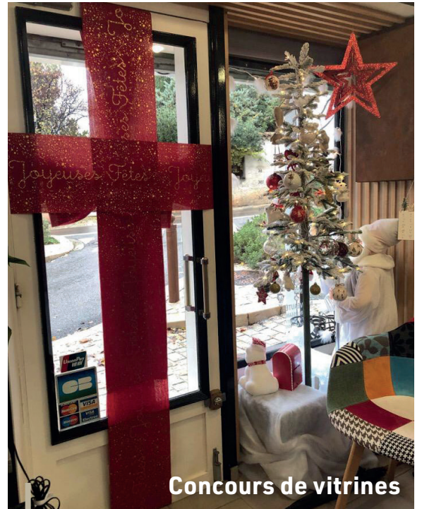
Concours de vitrines

Comme à son habitude, la crèche provençale de Ceyreste a pris ses quartiers dans la salle du moulin, de début décembre à mi-janvier. Vous pouviez y retrouver tout le Centre Ancien, de la Fontaine Romaine à la Chapelle Sainte Croix, en passant par l'Hôtel de Ville et le Cercle de l'Union. Merci aux petites mains qui oeuvrent plusieurs semaines avant son ouverture pour faire briller nos yeux de petits et grands enfants !