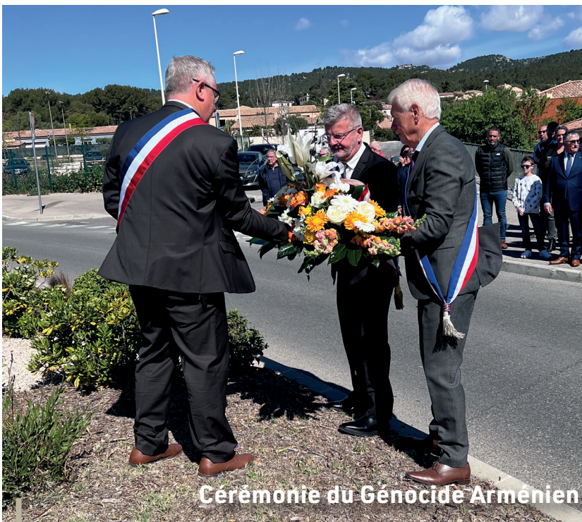
Cérémonie du Génocide Arménien

Ce sont au total 90 véhicules qui ont pris le départ ce dimanche de Rameaux. Une belle manifestation avec une organisation sans faille de Phocéa Productions en partenariat avec la ville de Ceyreste, Grand Caunet auto passion et l'écurie Soleil Classic. Un grand merci à tous les participants !