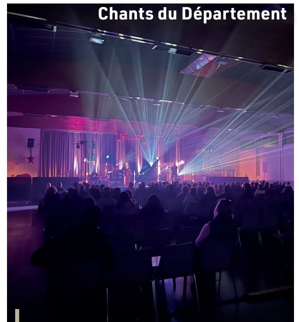
Chants du Département

Un marché de Noël avec du local et du fait main sur la place de la Mairie, les chorales des enfants des écoles place Cupif, la visite du Père Noël et enfin un spectacle pyrotechnique pour en mettre plein les yeux place Albert BLANC... On peut dire qu'à Ceyreste, Noël ne passe pas inaperçu !